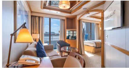
迷你套房 Junior Suite (Cat. B)

Size 面積：17 m 2 Including Balcony 連露台 Deck 樓層：9 (C2 / J), 10-12 (C1 / I)