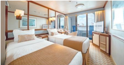
露台艙房 Balcony Cabin (Cat. C1 / C2 / I / J)

Semi-Single Outside (w curtain) Size 面積：14 m 2 Deck 樓層：5-6 (F2), 8 (E2)