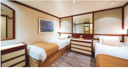
內艙房 Inside Cabin (Cat. G / M)

同行共享內艙 Semi-Single Inside (w curtain) (Cat. G2) Size 面積：13 m 2 Deck 樓層：8-12