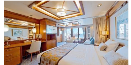
Premium Suite 尊爵套房 (Cat. A3)

Size 面積：33 m 2 Including Balcony 連露台 Deck 樓層：10