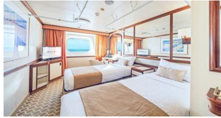
海景艙房 Outside Cabin (Cat. F / E / L / K / D2 / D1)

同行共享內艙 Semi-Single Inside (w curtain) (Cat. G2) Size 面積：13 m 2 Deck 樓層：8-12